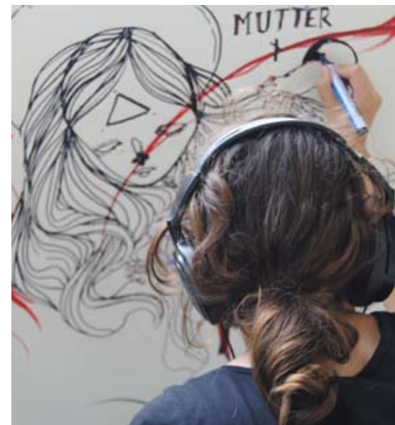
Studenten van Kunstacademie St. Joost maken een muurtekening tijdens GAND in Electron.

Meer informatie over De Cultuurkantine en Het Dossier: De Cultuurkantine op Facebook en Twitter